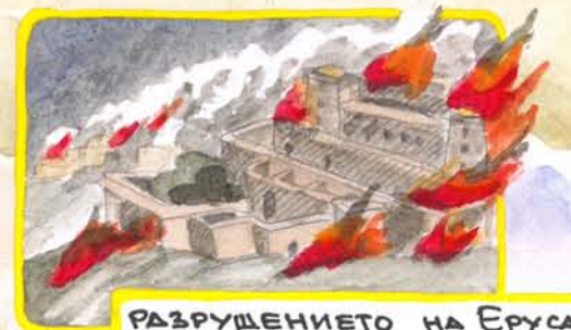
РАЗРУШЕНИЕТО НА ЕРУСАЛИМ - ЗАПАДВАНЕТО НА ХРАМА ОТ НАБУЗАРДАД

ПРОРОЦИ В ПЛЕН: ИЕШУ - ЗАХАРИЯ - МАЛАХИЯ